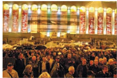
აქციის მშვიდობიანი მონაწილეები აქციის დაშლამდე

ნაწილი აღჭურვილი იყო პლასტმასისა და ხის ჯოხებით, ასევე, ფანერის პლაკატებით. საიას მიერ მოძიებული ფაქტობრივი მასალების მიხედვით, აქციის მონაწილეთა ასეთ ნაწილს დაახლოებით 150-200-მდე პირი წარმოადგენდა, რაც აქციის დაშლის მომენტისთვის დემონსტრანტების სრული ოდენობის (1700-მდე კაცი) 9-12% იყო. ჩვენ მიერ მოძიებული ფაქტობრივი მასალებით და ხელისუფლების მიერ გაკეთებული განცხადებებით არ დასტურდება, რომ მონაწილეებს ჰქონდათ ცივი იარაღი ან/და ცეცხლსასროლი იარაღი, მათ შორის, აქციის დაშლის დროს. დემონსტრანტების მხრიდან ასევე ადგილი არ ჰქონია სიტუაციის სხვაგვარი ესკალაციის ფაქტებს. ამდენად, 25-26 მაისს აქციის დაშლის მომენტისთვის დემონსტრანტების ქცევა პოლიციისთვის პროგნოზირებადი იყო, რაც ოპერაციის დაგეგმვისა და რისკების გათვლის პროცესს ხელს უწყობდა.