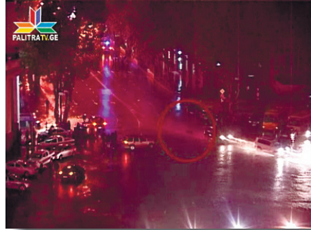
თავისუფლების მოედანზე ავტოკოლონის გადაადგილება