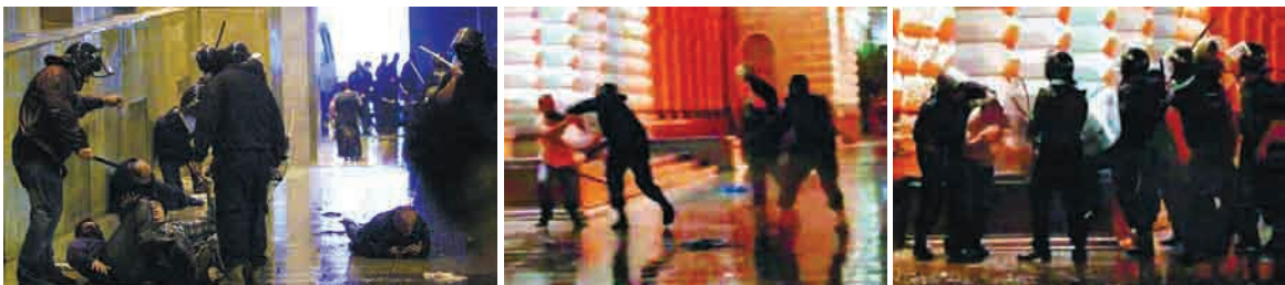
სპეცრაზმელების მიერ ქალის გადამეტების ამსახველი ფოტოები

ყველა ზემოთ აღნიშნულ შემთხვევაში, რეზინის ხელკეტით ნაცემი ადამიანები ან არავითარ თავდასხმას არ ახორციელებენ პოლიციაზე, ან რეზინის ხელკეტის გამოყენების მომენტი-სათვის ამგვარი თავდასხმა უკვე აღკვეთილია, საზოგადოებრივი წესრიგის დამრღვევი პირი დაკავებულია და არანაირ წინააღმდეგობას არ უწევს სამართალდამცავი ორგანოს წარმომადგენლებს. ადამიანები, რომლებსაც სცემენ რეზინის ხელკეტებით, ან არავითარი მასობრივი და ჯგუფური საზოგადოებრივი წესრიგის დარღვევაში იმ მომენტი არ მონაწილეობენ, ან ხელკეტის გამოყენების მომენტისათვის მათი ამგვარი მონაწილეობა უკვე აღკვეთილია.