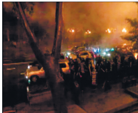
ავტოკოლონის უკან მომავალი აქციის მონაწილეები