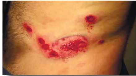
ქ. სტალინსკის დაზიანებები

საც მივხვდი, რომ ჟურნალისტობის მიუხედავად მაინც გვესროდა, შევეცადე, გადავფარებოდი ჩემს კოლეგას, ნაბიჯი სპეცრაზმელისკენ გადავდგი და კიდევ ერთხელ გავუმეორე, რომ ჟურნალისტი ვიყავი, თან თვალეში ვუყურებდი. ამ დროს ჩვენ შორის მანძილი 3-4 მეტრს არ აღემატებოდა. როდესაც ხმამაღლა კვლავ ვუთხარი, რომ ჟურნალისტი ვიყავი, თოფი დამიმიზნა და კიდევ ერთხელ მესროლა.” 263