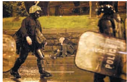
პოლიციის მიერ ძალის გადამეტების შედეგად დაშავებული აქციის მონაწილეები