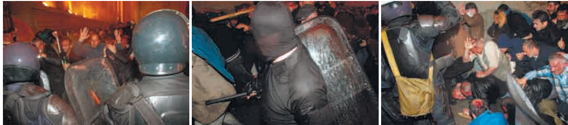
სპეცრაზმელები საიდენტიფიკაციო ნიშნის გარეშე. ბოლო სურათზე ჩანს რომ ჩაფხუტზე საიდენტიფიკაციო ნომერი წაშლილია.

აღსანიშნავია, რომ სპეცდანიშნულების რაზმელთა და პოლიციელთა ფორმებს მასობრივად არ ჰქონდა ნიშანი (სახელი, გვარი ან ნომერი), რომლითაც მათი იდენტიფიცირება შესაძლებელი იქნებოდა.