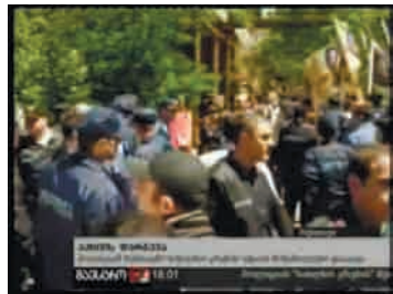
საგარეულო პროვოკატორის ამსახველი ფოტო მასალა. მარჯვენა სურათზე ასახულია პოლიციის მიერ აქციის დაშლა

ტელეკომპანია „მაესტროს“ მიერ გავრცელებულ ვიდეო მასალაში, სადაც დაფიქსირებულია აქციის დაშლა და მონაწილეთა დაკავება, არ ჩანს აქციის მონაწილეთა მხრიდან არც ჯგუფური და არც ინდივიდუალური წინააღმდეგობის განხორციელება არც ერთი შემთხვევა. მიუხედავად ამისა, ვიდეო მასალაში ისმის პოლიციის წარმომადგენლების სიტყვები „ნუ იგინები“, რომლითაც ისინი დაკავებულ პირებს მიმართავენ. ვიდეო მასალაში ასევე ჩანს, რომ დაკავებულები, რომ-