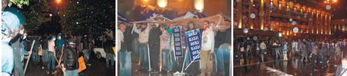
შეფიცულების ორგანიზებული ქცევა აქციის დაშლამდე

მონაწილეების რაოდენობა ყველაზე მცირე დაშვებით 1700-ს შეადგენდა, შეფიცულების რიცხვი კი – დაახლოებით 150-300-ს.