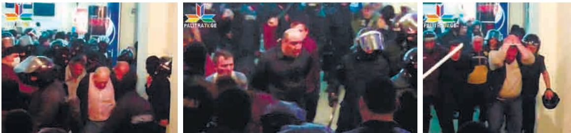
კინოთეატრ „რუსთაველში“ სპეცრაზმის მიერ ჩატარებული ოპერაციის ამსახველი ფოტოები

ზემოხსენებული შემთხვევები ნათლად მიუთითებს პოლიციის მიერ დაკავებული ადამიანების მიმართ არაჰუმანურ და დამამცირებელ მოპყრობაზე, რაც აკრძალულია ადამიანის უფლებათა ევროპული კონვენციის მე-3 მუხლით.