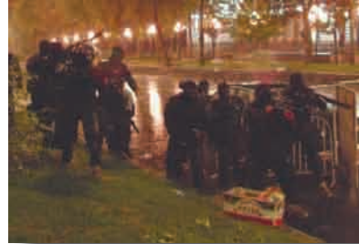
შეტევა ფურცელადის ქუჩის მიმართულებიდან

აქციის პირველ ეტაპზევე, სანამ აქციის მონაწილეების გაფანტვა მოხდებოდა, სპეცრაზმი ფურცელადის ქუჩის კუთხიდან აქტიურად იყენებდა რეზინის ტყვიებს, რომელსაც ის აქციის მონაწილეების მიმართულებით დამიზნებით ისროდა. 120 ამასთან დაკავშირებით, საინტერესოა ჟურნალისტ დავით მჭედლიძის ახსნა-განმარტება: „ამ დროს ფურცელადის ქუჩიდან სპეცრაზმელები ამოვარდნენ, რომლებიც ტროტუარის ამალგებულ ადგილიდან, დაახლოებით 2-3 წუთის განმავლობაში, დამიზნებით ისროდნენ აქციის მონაწილეების მიმართულებით. შემდეგ უკან, ფურცელადის ქუჩისკენ დაიხიეს და ისინი ხელკეტებთან სპეცრაზმელებმა ჩაანაცვლეს.“ 121