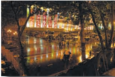
აქციის მონაწილეები აქციის დაშლამდე

ადგილის გამოყოფა შესთავაზა, რაზეც უარი მიიღო. 80 ამ დროიდან, და უფრო ადრეც, აქციის ლიდერების მიერ გაკეთებული ზეპირი განცხადებებიდან გამომდინარე, ხელისუფლებისთვის აშკარა იყო, რომ 26 მაისისთვის აქციის მონაწილეები დაშლას არ აპირებდნენ. შესაბამისად, შინაგან საქმეთა სამინისტროს გააჩნდა საკმარისი დრო (რეალურად – 8 საათი, მინიმუმ – 4 საათი), რათა სათანადოდ დაეგეგმა აქციის დაშლის ოპერაცია და გაეთვალა აქციის დაშლის ტაქტიკა ყველაზე ნაკლები დანაკარგით.