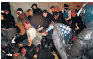
სპეცრაზმის მიერ ჩიხში მოქცეული აქციის მონაწილეები

აქციის დაშლის პროცესი დაახლოებით 15-20 წუთში დასრულდა. 109