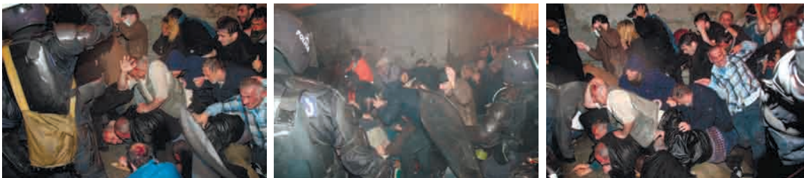
აქციის მშვიდობიანი მონაწილეები აქციის დაშლის დროს