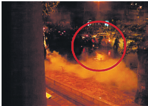
თავისუფლების მოედნის მეტროს გასწვრივ ავტოკოლონის გადაადგილება

"[...] ამ დროს გავკარი, ჩემი აზრით, იმ წუთას ვერ ვიგრძენი, მაგრამ როგორც ჩანს [სავარაუდოდ უთითებს გავრცელებულ ვიდეო მასალაზე], მერე გავკარი ალბათ სარკე და დავაკარგვინე წონასწორობა ამ პიროვნებას, რომელსაც შემდგომ უკანა მანქანამ გადაუარა..."