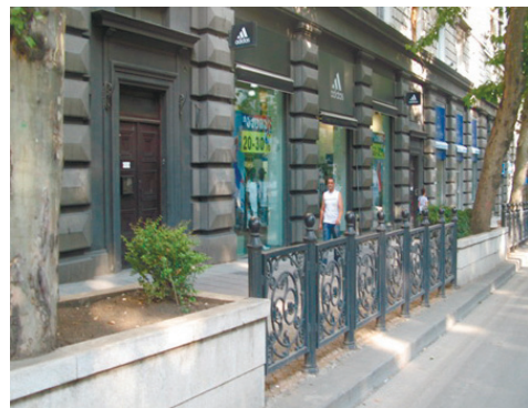
მაღაზია "Adidas"-ის წინ მდებარე გზის მონაკვეთი.