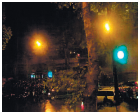
მოდრავ ავტომანქანებს პოლიციელების ცოცხალი კორდონი წინ ხვდება