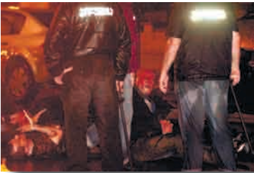
სამართალდამცავები სპეციალური ეკიპირების გარეშე

როგორც სამუშაო ჯგუფის მიერ მოპოვებული ფაქტობრივი მასალებით მტკიცდება, აქციის დაშლის პროცესში მონაწილეობდნენ როგორც სპეცდანიშნულების რაზმის წევრები, ასევე პირები, რომლებსაც ჯინსები, სამოქალაქო ფეხსაცმელები, ტანზე კი წითელი ფერის ქურთუკები ეცვათ ნარწერიტ „პოლიცია“. მათ სახეზე ნაჭრის ნიღბები ეკეთათ ან ჩაფხუტები ეხურათ. აქციის დაშლის პროცესში ასევე მონაწილეობდნენ ლურჯი ფერის ფორმებში ჩაცმული პოლიციელები. შს სამინისტროს მიერ მოწოდებული ინფორმაციით, აქციის დაშლის პროცესში მონაწილეობდნენ მხოლოდ შსს-ს შესაბამისი დანაყოფების თანამშრომლები. 112