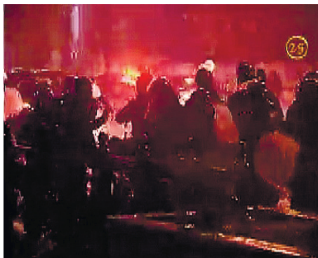
ადგილი, სადაც 25-ე არხის მიერ გადაღებულ ვიდეოში სპეცრაზმელების ჯგუფი სასტიკად სცემს აქციის მონაწილეს